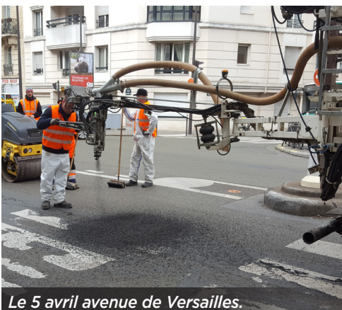
Le 5 avril avenue de Versailles.