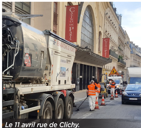
Le 11 avril rue de Clichy.