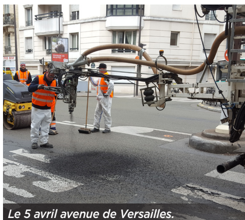
Le 5 avril avenue de Versailles.