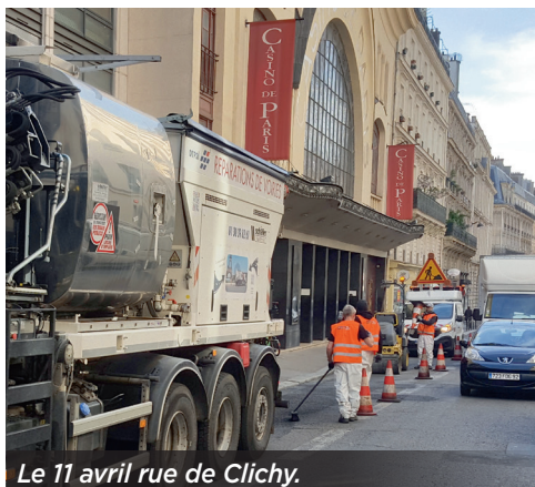
Le 11 avril rue de Clichy.